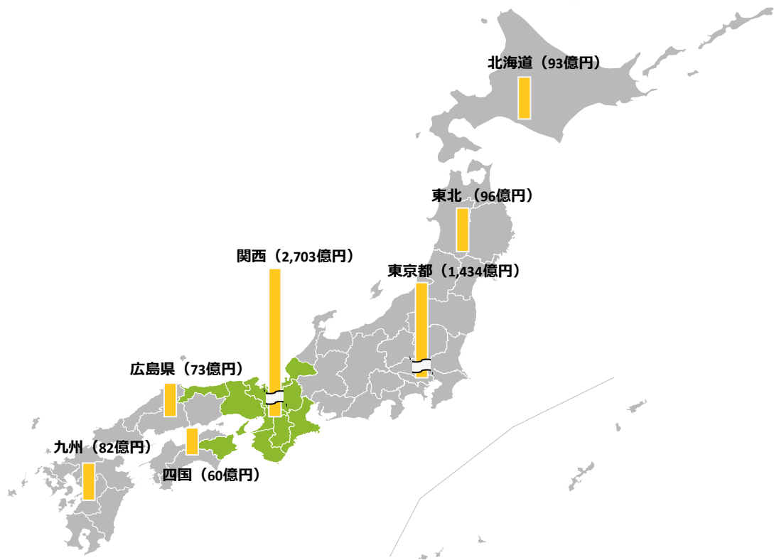
図表 2 訪日外国人旅行者のうち万博来場者による経済効果の波及

※万博来場者による消費額は主な地域について集計したものであり、日本全体の数値とは一致しない