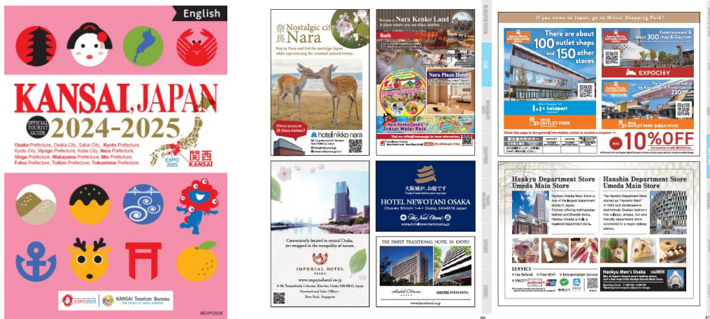
▲冊子イメージ「KANSAI OFFICIAL TOURIST GUIDE 2024-25」

https://www.the-kansai-guide.com/kansai-guide/data/download/2024/kansai_guide_24_E.pdf