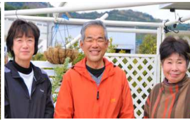
NPO 法人 CRUISE ARIDA・さんさんカルテット