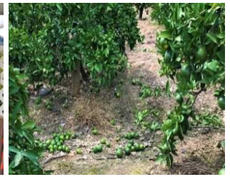
（廃棄される青みかん ※）

この取り組みは、温州みかんを生産する過程で果実を間引きする際に生まれる【廃棄される運命にある「青みかん※1」】を活用して新しい価値を創出することを目的とし、「地域農家×有田市×塩野香料×ANA あきんど」が連携し、企画立案いたしました。