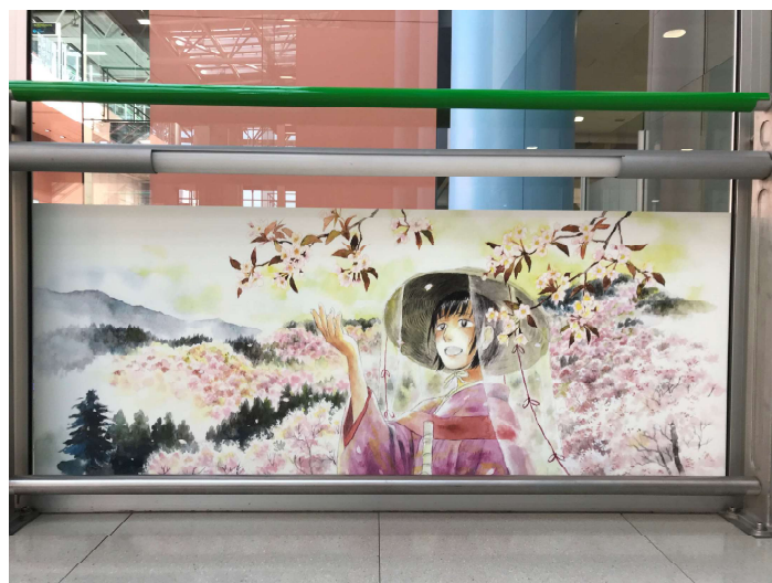
「巡礼の道（紀伊半島）」